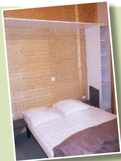
les chambres le camere