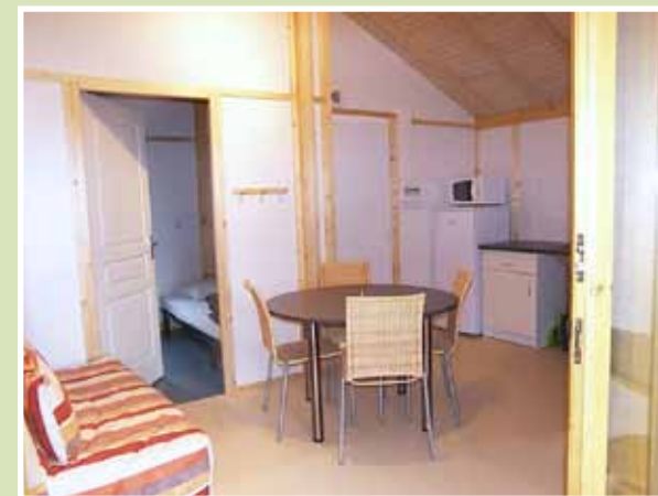
le séjour il soggiorno