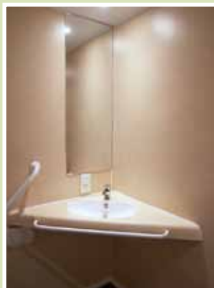
la salle de bains la sala da bagno