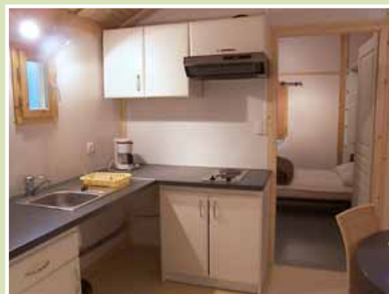
la cuisine la cucina