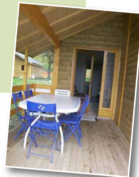
la terrasse il terrazzo